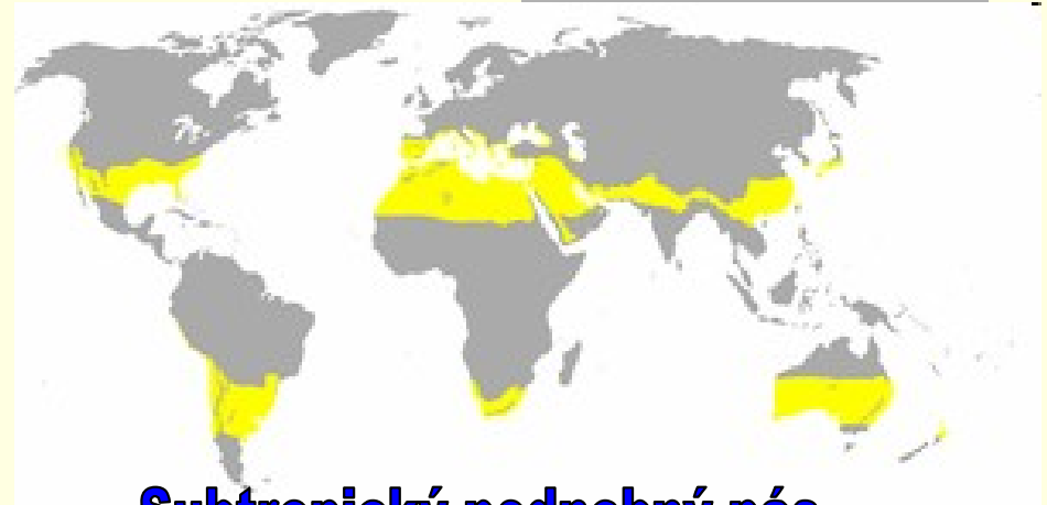
Subtropický podnebný pás