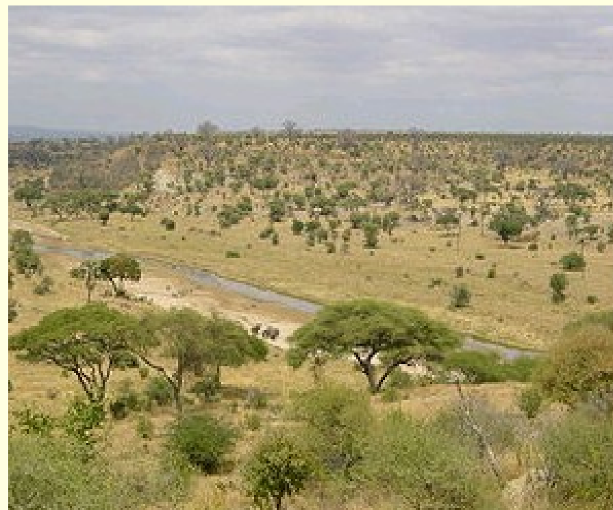
Tarangire National Park v Tanzanii.