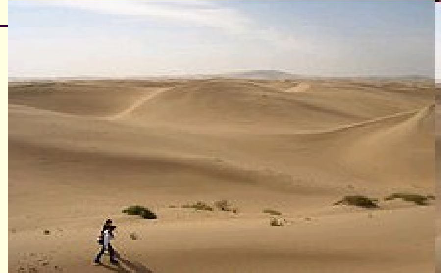
Poušť Gobi v Mongolsku