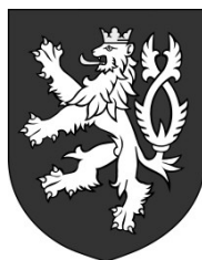
Malý státní znak