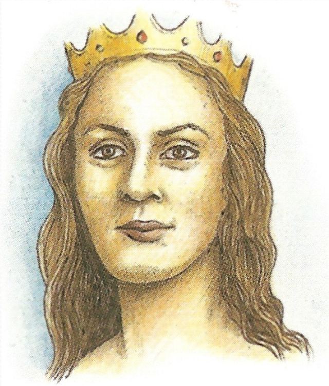
Anna Svídnická 1339 - 1362

Roku 1353 se oženil potřetí. Vzal si Annu Svídnickou, se kterou měl dceru Alžbětu a syna Václava IV. V roce 1355 byl korunován na krále Itálie a římského císaře. Po korunovaci na krále Burgundska se stal panovníkem všech království Svaté říše římské.