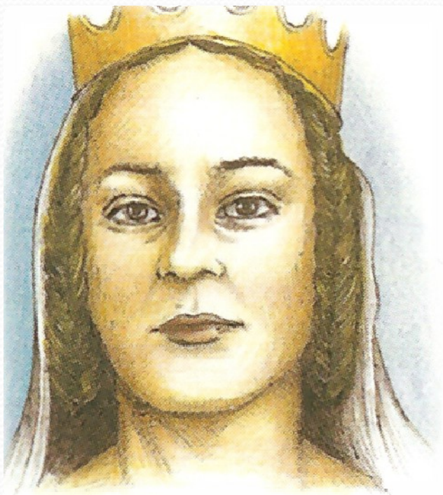
Blanka z Valois 1316 - 1348

V roce 1323 se v Paříži oženil s Blankou z Valois, se kterou měl dvě dcery (Markétu a Kateřinu). Ovládal několik jazyků. Naučil se mluvit německy, francouzsky, latinsky a italsky .Česky se naučil až po návratu do českých zemí.