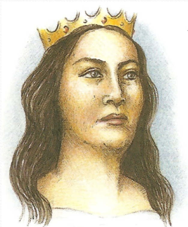
Anna Falcká 1328 - 1353

V roce 1347 byl korunován na českého krále a založil Karlovu Univerzitu. Roku 1348 se podruhé oženil. Vzal si Annu Falckou a měl s ní syna Václava.