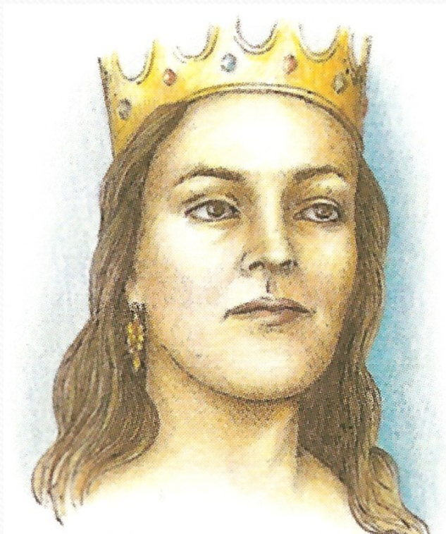
Alžběta Pomořanská 1347 - 1393

V roce 1362 se žení počtvrté, tentokrát s Alžbětou Pomořanskou, s níž měl 6 dětí (Annu, Zikmunda, Jana, Karla, Markétu a Jindřicha).