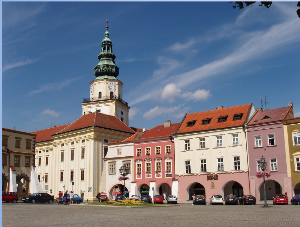
Náměstí v Kroměříži, v pozadí Arcibiskupský zámek

Kroměříž leží na řece Moravě. Žije zde okolo 30 000 obyvatel a je jedním z okresních měst Zlínského kraje. Dominantou tohoto historického města je Arcibiskupský zámek.