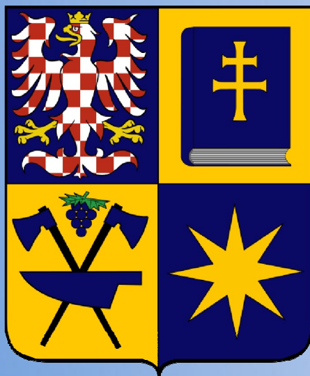
Znak Zlínského kraje