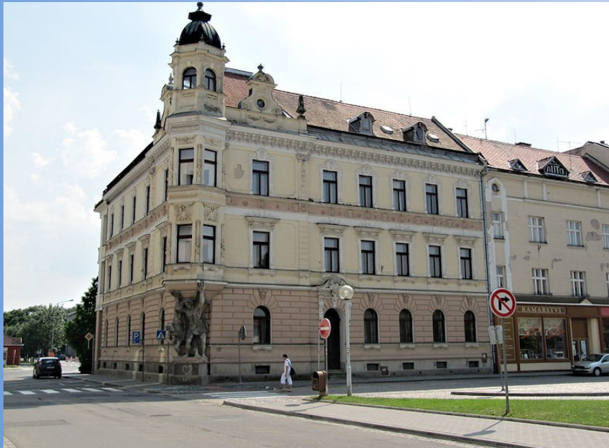
Pohled do Uherského Hradiště

Uherské Hradiště je okresní město ve Zlínském kraji s 27 000 obyvateli. Městem protéká řeka Morava a je středem regionu Slovácka. Historické jádro města bylo prohlášeno městskou památkovou zónou. V minulosti tady ve městě a okolí ležela významná střediska Velkomoravské říše.