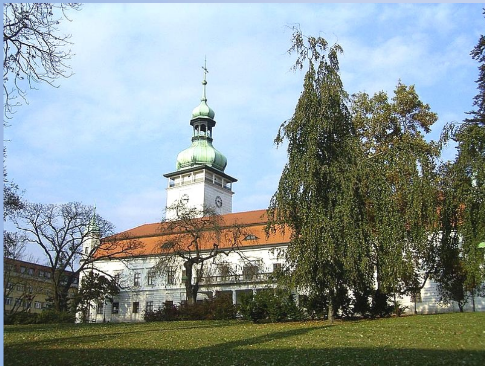
Zámek ve Vsetíně

Vsetín je okresní město ve Zlínském kraji s 28 000 obyvateli. Městem protéká řeka Vsetínská Bečva.