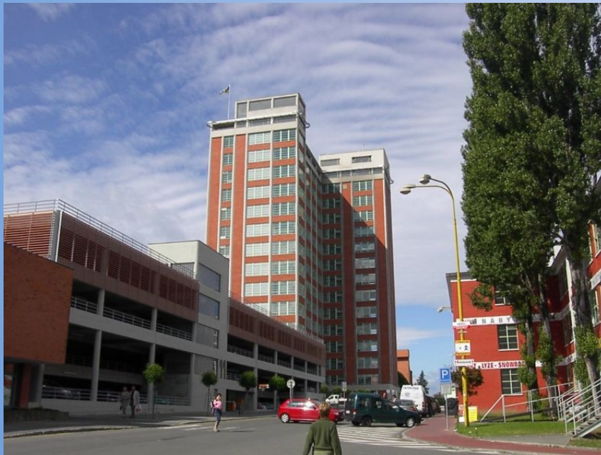
Pohled do Zlína

Zlín leží v údolí řeky Dřevnice. Je centrem Zlínského kraje a má téměř 80 000 obyvatel. Proslul hlavně výrobou obuvi díky podnikateli Tomáši Baťovi, který zde vybudoval továrnu.