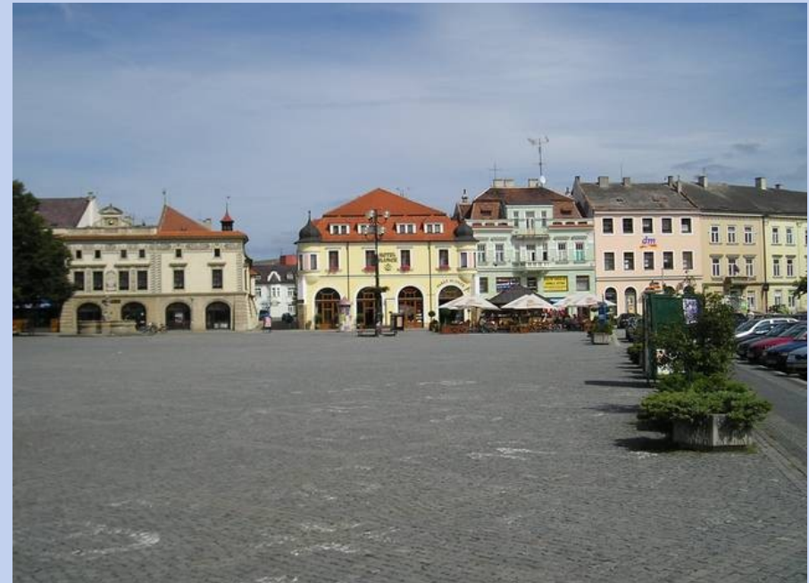
Náměstí v Uherském Hradišti