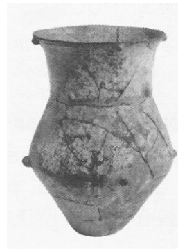
Keramická váza (z mladší doby kamenné)