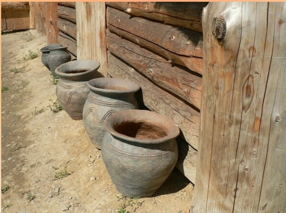
Ukázka slovanské keramiky

Kromě zemědělství se staří Slované zabývali také řemeslem. Své příbytky stavěli převážně ze dřeva, taktéž své zbraně. Hovořili společným jazykem – praslovanštinou (písmo se vyvinulo až později).